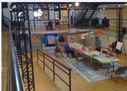
Journée de la culture 2008