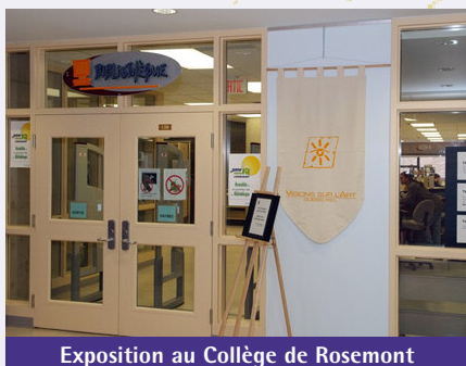
Exposition au Collège de Rosemont