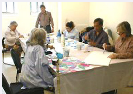
Cours de peinture gestuelle

Nous avons également aidé à la promotion du spectacle « Ça roule... Action! » donné par la compagnie de danse intégrée Corpuscule Danse, dirigée